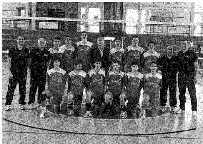
L'Under 16 della Callipo ha vinto il titolo regionale a Cosenza